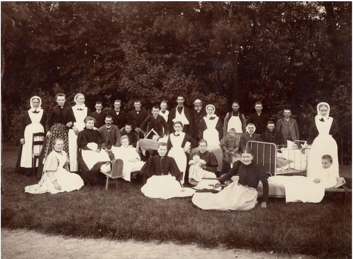
Præstø Amtssygehus 1889. (B4662)